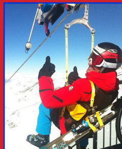
雪山飛狐 FLYING FOX

費用包括： 旅遊巴士、華人導遊、3 晚住宿、3 個早餐、2 個海鮮火鍋晚餐、雪山公園入場費、消費稅。 自費項目： 雪具、上山纜車、導遊服務費 $5 每人每天、個人保險、嬰兒 $90 每人、單人房付加費 $160 每人、學校假期周末出發付加費 $20 每人。 Price includes: 3 nights accommodation, 3 breakfast, 2 hotpot dinner, national park admission fee. Price does not include: ski equipment, mountain pass, insurance, service charge $5pp. Infant $90pp, single surchagre $160pp. School Holiday/weekend surcharge $20pp.