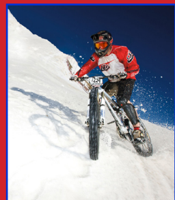
山地自行車 MOUNTAIN BIKE