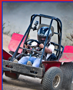
山地越野車 DIRT BUGGY